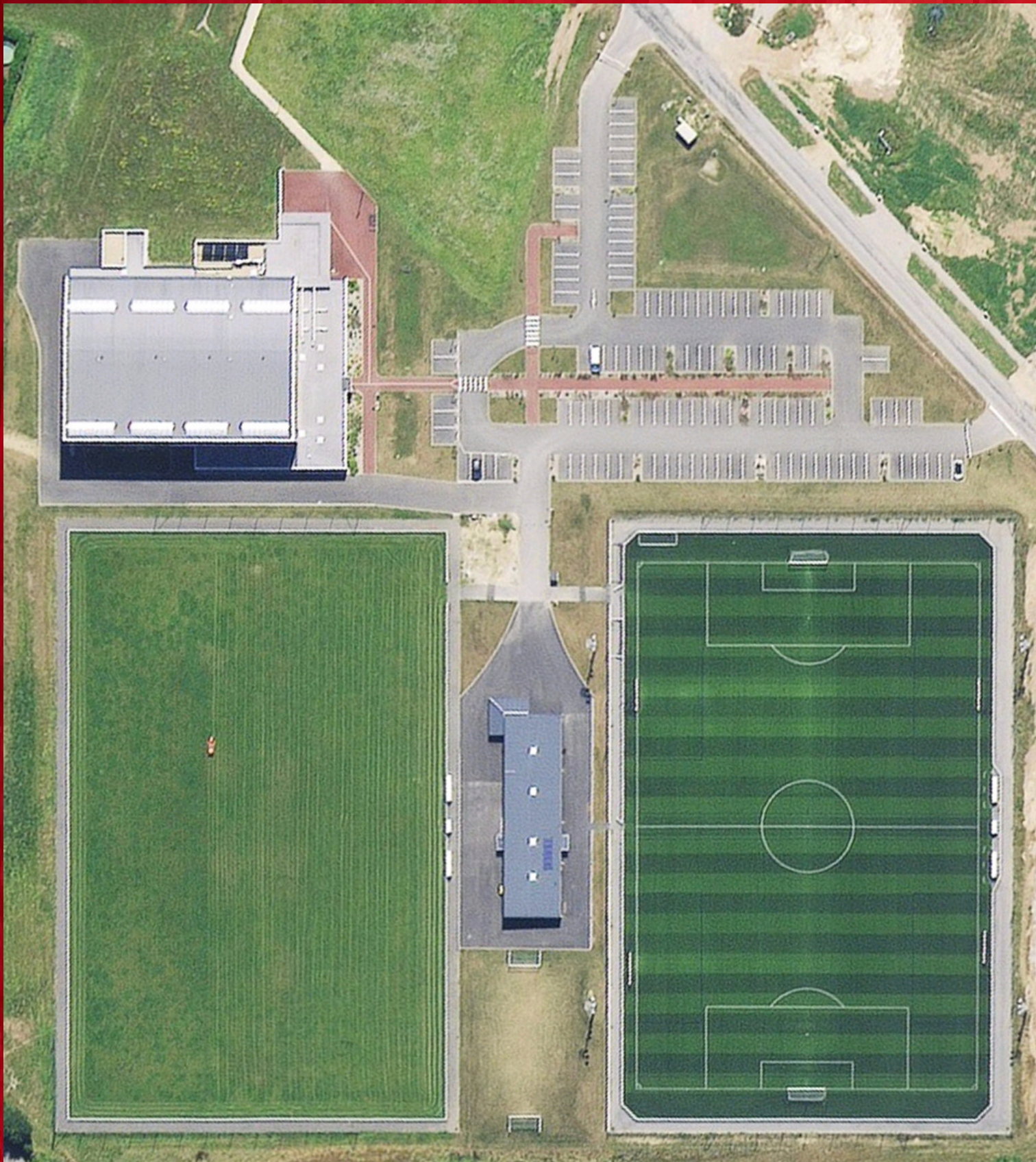
LE COMPLEXE SPORTIF SPORT TI BRECH